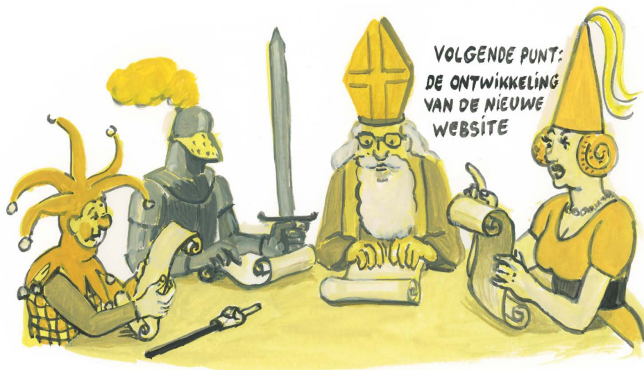
OVERLEG BINNEN ERFGOED CELLEN